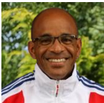
ISSORAT Claude Courses Fauteuils