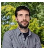
GOUDE Renaud Communication