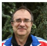
JACQUOT Hervé Gestion des compétitions Table de cotation